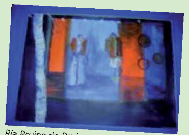
Ria Bruine de Bruin