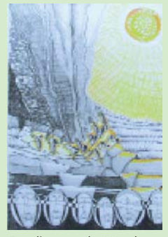
Engelen van der Weyden