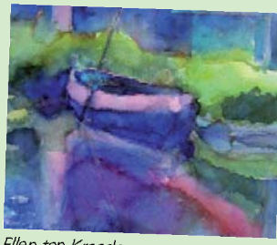
Ellen ten Kroode