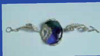
Ebriena de Meijer