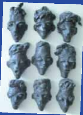
Lies van den Beld