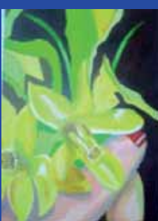
Ria Bruine de Bruin