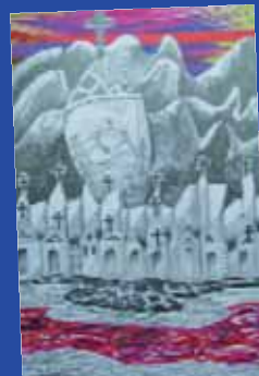
Engelien van der Weijden